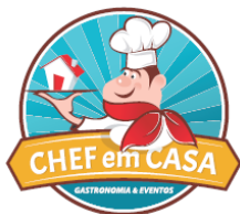
TABELA DE PREÇOS MÊS DE MAIO/2020 – MASSAS FRESCAS E MOLHOS PARA ENTREGA/SISTEMA DELIVERY

Como funciona o serviço: Encomendas sempre até às quartas-feiras (limite às 20h) e as entregas serão para o final de semana. Ocorrerão somente aos sábados, assim você pode saborear uma comida fresca para seu jantar de sábado ou para o domingo. Não é produto congelado. As instruções para aquecer serão enviadas por WhatsApp. Nossas entregas não são terceirizadas (taxas terão variação entre R$ 10,00 e R$ 25,00 e a mesma será acrescida aos valores do seu pedido dependendo do bairro de entrega, consulte previamente).